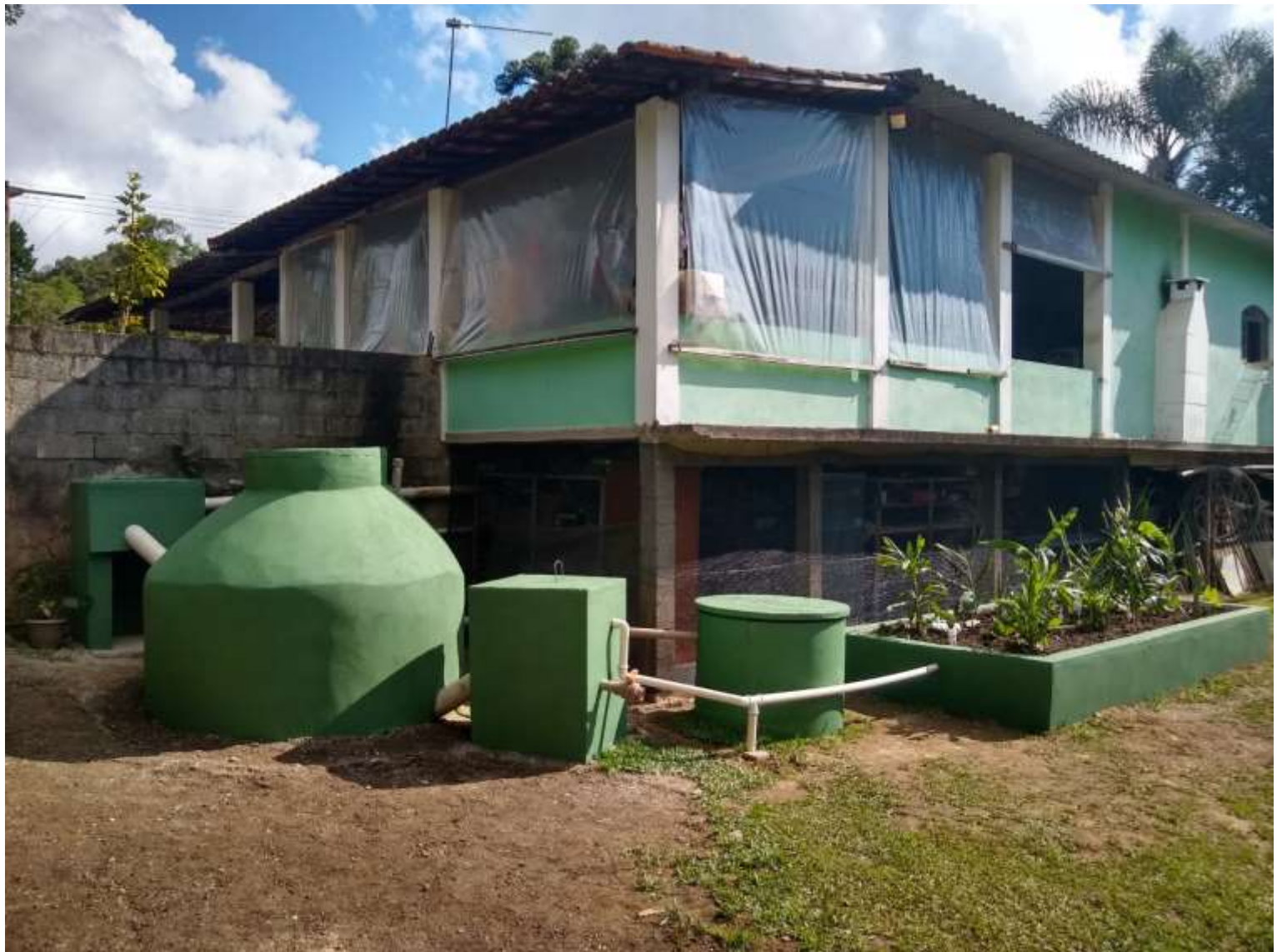
Estruturas do biossistema Bairro Verava